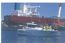
協力:ヨットハーバー